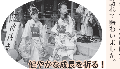
健やかな成長を祈る！

「秋の三角八丁」が開催された当日、子どもの健やかな成長を祈って、秋宮には多くの親子連れが参拝に訪れて賑わいました。