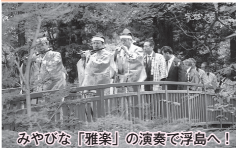
みやびな「雅楽」の演奏で浮島へ！