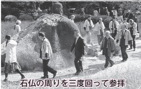
石仏の周りを三度回って参拝